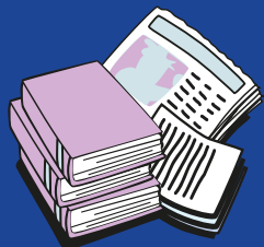
Periódicos, libros, revistas y bolsas de papel