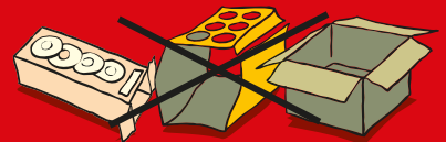
Envases y cajas de cartón