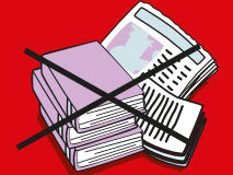
Libros y diarios