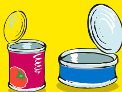
Latas de conserva