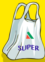
Bolsas de plástico de comercio