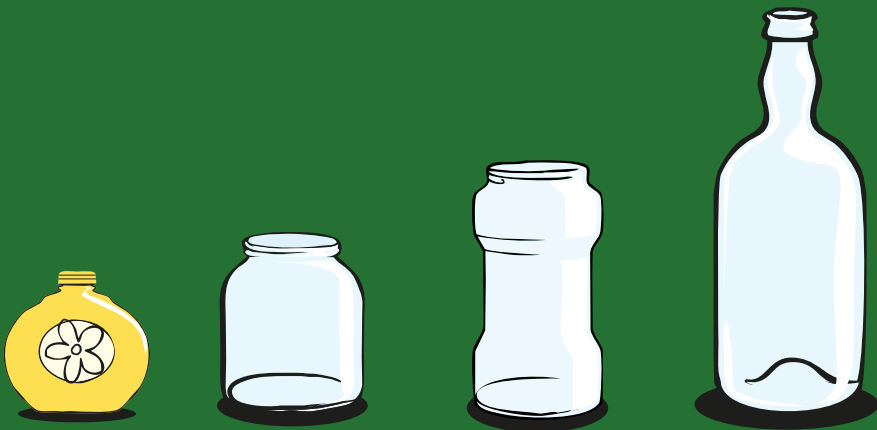
Botellas de vidrio, frascos y tarros