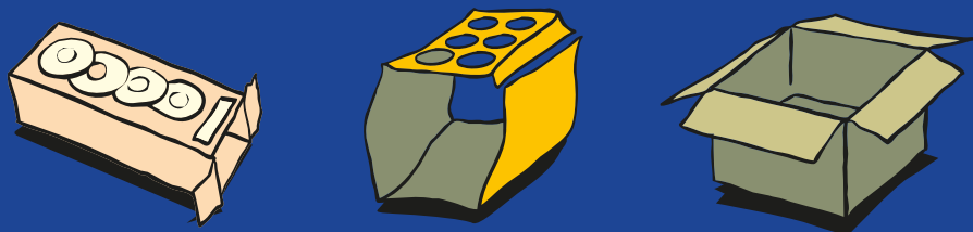
Envases y cajas de cartón