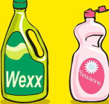
Productos de limpieza